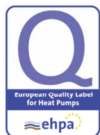
Vitocal 222-S je certificirana po evropskem certifikatu EHPA za toplotne črpalke

Kompaktna split toplotna črpalka zrak/voda za novogradnjo in posodobitve ogrevalnih sistemov, z integriranim ogrevalnikom sanitarne vode za veliko udobje tople vode.