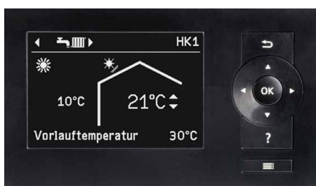
Zaslon regulacije toplotne črpalke Vitotronic 200