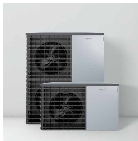
Nove zunanje enote v Viessmann dizajnu – Made in Germany

Z regulacijo Vitotronic se rokuje enostavno in intuitivno. V kolikor se toplotna črpalka kombinira s centralnim prezračevalnim sistemom Vitotent 300-F, lahko s to regulacijo rokujete z obema napravama. Z internet komunikacijskim modulom Vitocom 100 in brezplačnim Vitotrol App je mogoče rokovanje na daljavo in preko pametnega telefona.